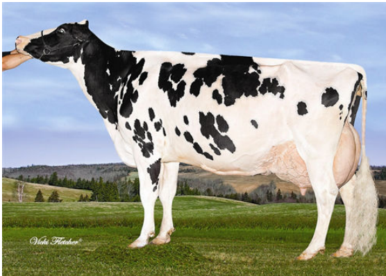
GERANETTE F B I LAURIE