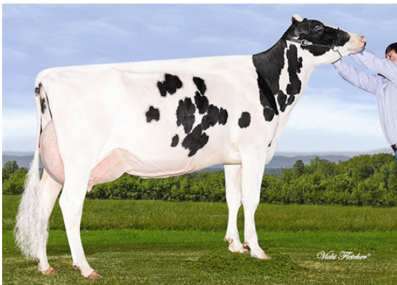
GERANETTE BOLTON LAURE